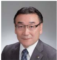
国際ロータリー第2580地区 2018-19年度ガバナー